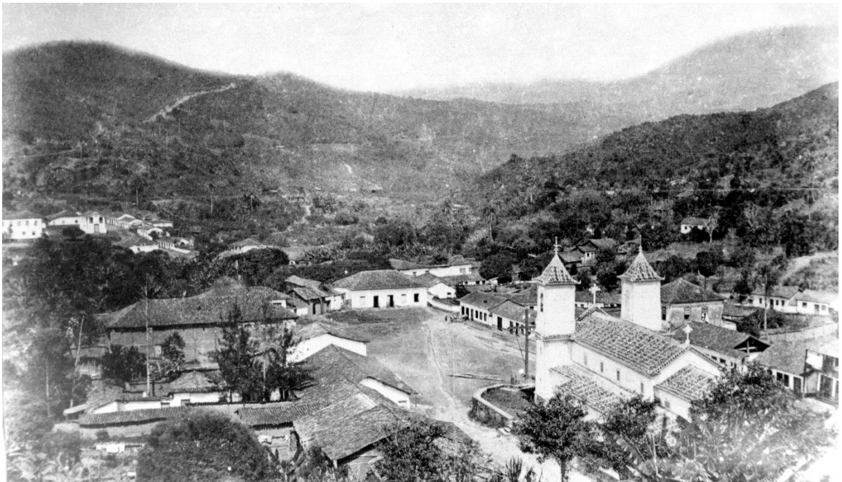
Foto 3 – Vista do Morro do Cruzeiro - a esquerda, antes de seu povoamento.