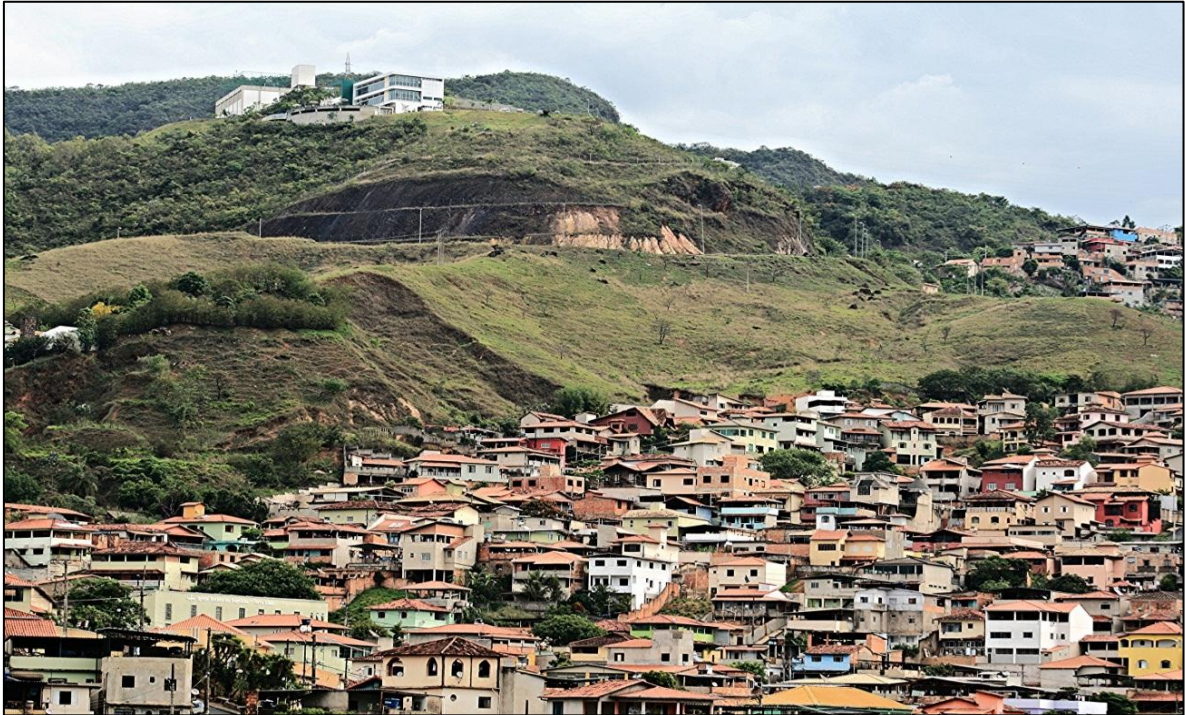
Foto 1 – densidade demográfica em um bairro central e em um condomínio

não há espaço, em uma sociedade hierarquizada, que não seja hierarquizado e que não exprima as —hierarquias e as distâncias sociais sob uma forma (mais ou menos) deformada e sobretudo dissimulada pelo efeito de naturalização que a inscrição durável das realidades sociais no mundo natural acarreta, diferenças produzidas pela lógica histórica podem assim aparecer surgidas das naturezas das coisas (basta pensar na ideia de fronteira natural ). (BOURDIEU, 1997, p, 60)