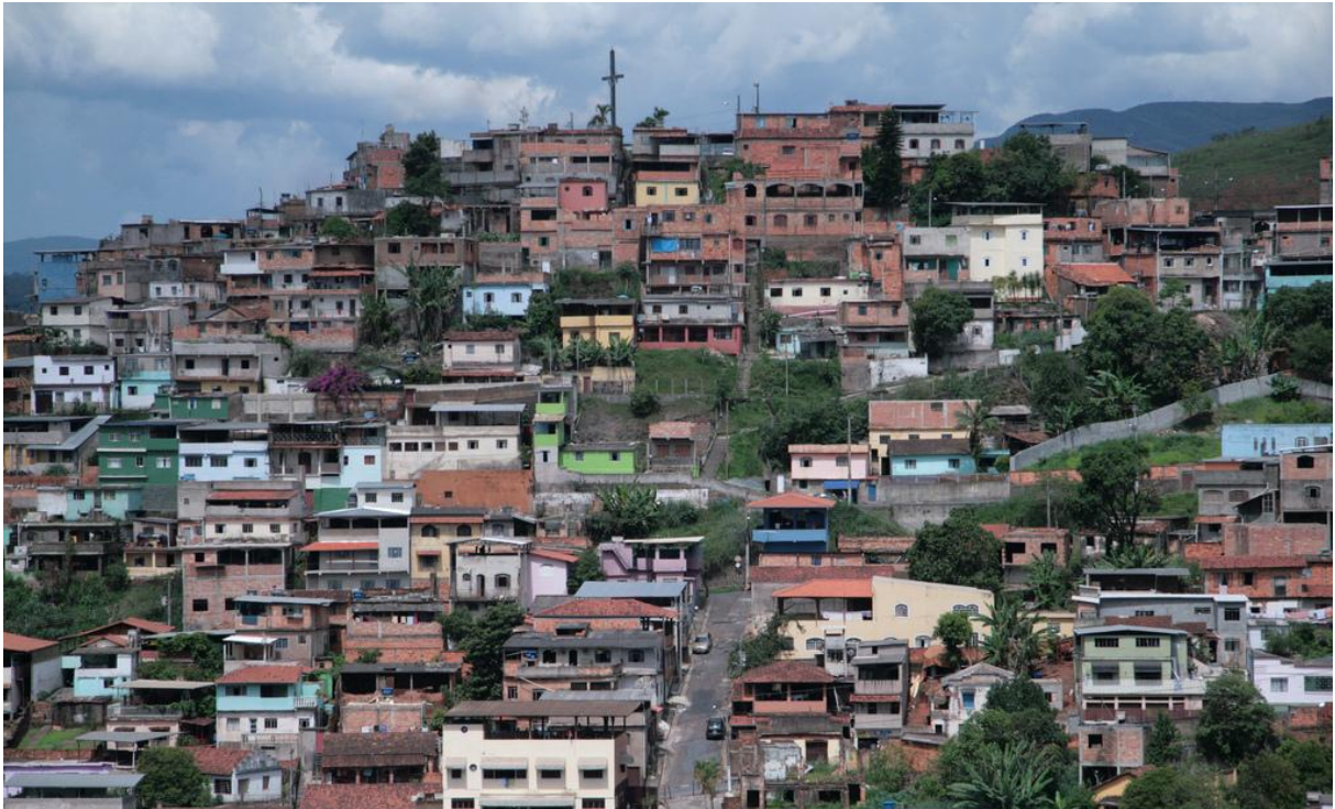
Foto 4- Vista do Cruzeiro, a partir do centro da cidade