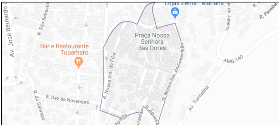
Imagem 2 - Mapa do Cruzeiro