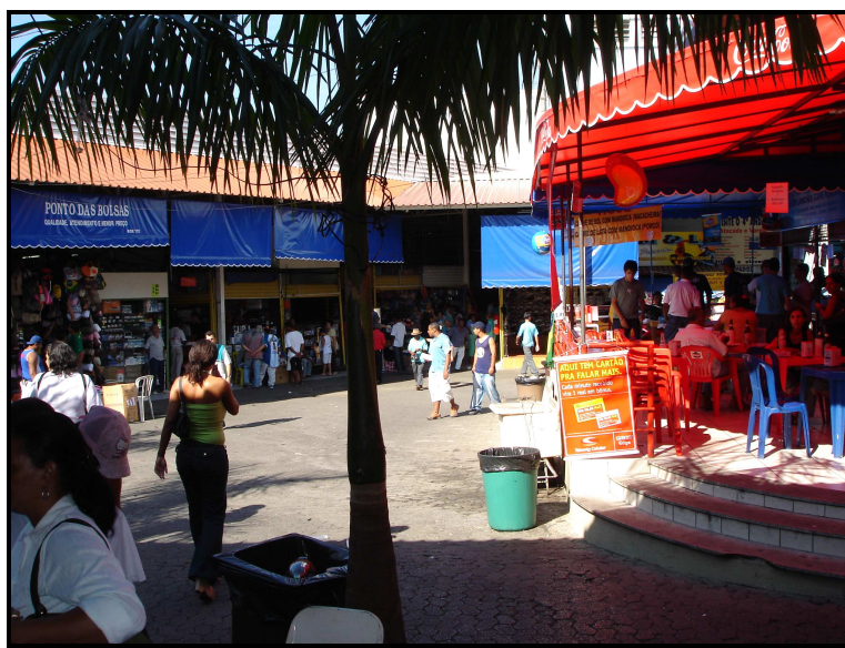
FIGURA 04: Pátio II do Shopping Oiapoque

Internamente, o Oiapoque é tão ou mais confuso como quaisquer outros shoppings populares de Belo Horizonte. Há vários setores distribuídos em vários corredores e identificados por cores, algumas escadas e rampas e a sinalização não o faz de forma precisa. Outro ponto interessante diz respeito às diferenças existentes entre os vários setores: alguns são espaçosos, os corredores são largos e os boxes são maiores, outros, porém, têm corredores muito apertados – verdadeiros “becos” – os boxes são pequenos e muito próximos uns aos outros. Há, ainda, uma parte descoberta onde está sendo construído um telhado. No shopping há vários restaurantes e lanchonetes próximos uns dos outros; ou seja, há uma praça de alimentação. Há banheiros que, como nos demais shoppings , são pagos pelos consumidores e, gratuitos para seus “empreendedores”.