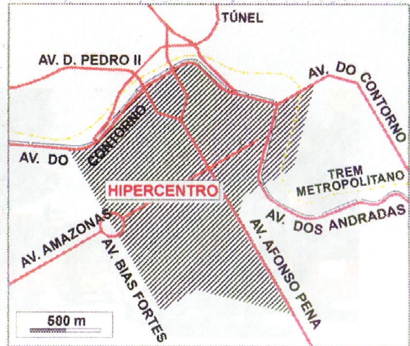
MAPA 01: Hipercentro de Belo Horizonte