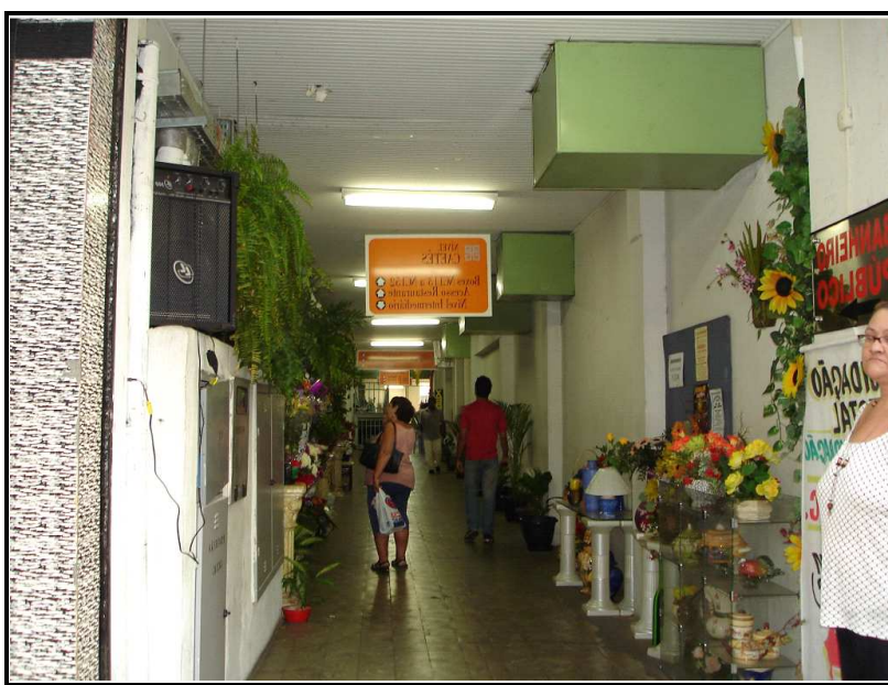
FIGURA 23: Entrada do Shopping Caetés pela Rua Caetés

As entradas do Caetés possuem cada uma sua particularidade, sendo que a entrada pela Avenida Santos Dumont – em expansão – caracteriza-se por ser ampla, aberta, com várias portas e bem iluminada. Já a entrada da Rua dos Caetés apresenta-se de forma não comercial, com uma fachada externa sóbria, pouca atrativa, estreita e mal iluminada, com um corredor longo, vazio e ocupado por uma floricultura que não caracteriza bem os produtos comercializados nos shoppings populares. Cabe ressaltar, ainda, que a fachada externa e a placa que sinaliza o shopping não se destacam no conjunto arquitetônico local. A entrada pela Rua Rio de Janeiro é também estreita com somente uma porta e um grande degrau; além disso, no quarteirão do shopping a movimentação de veículos é pequena. Porém apesar disso, os boxes localizados na entrada comercializam mercadorias típicas de um shopping popular.