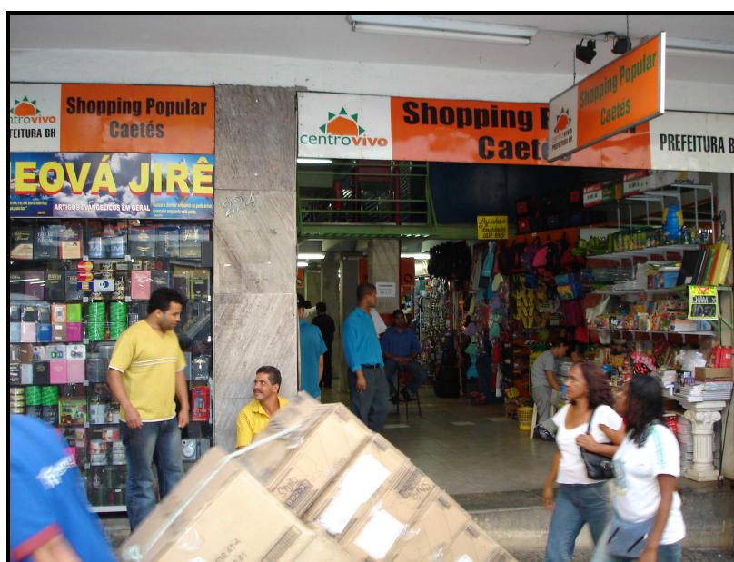
FIGURA 24: Entrada do Shopping Caetés pela Av. Santos Dumont