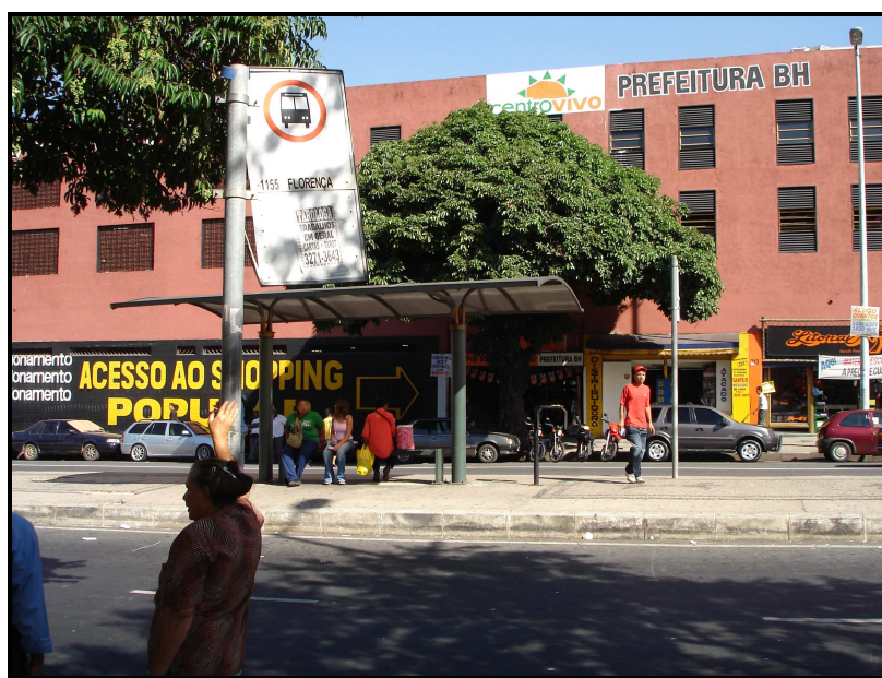
FIGURA 08: Fachada externa do Shopping Xavantes

O “Xavantes Pop Shopping ” foi o segundo a ser inaugurado, juntamente com o shopping Tupinambás, em agosto de 2004. Está localizado na Rua Curitiba, 149, Centro, com 293 boxes e duas entradas, uma no endereço acima e a outra em frente ao Shopping Oiapoque. O Xavantes está situado entre as Ruas São Paulo e Curitiba e a Rua Oiapoque e possui pequena extensão. Esse shopping ainda tem como referência a proximidade com a Rodoviária e a estação do metrô “Lagoinha”.