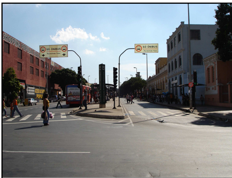
FIGURA 03: Rua Oiapoque onde está localizado os Shoppings Oiapoque e Xavantes

Vários pontos de ônibus localizam-se em frente ao shopping , já que uma estação BH BUS foi instalada na Avenida Oiapoque, e, com isso grande número de pessoas embarcam e desembarcam todos os dias no local. Além disso, o shopping é bem divulgado sendo articuladas várias propagandas na mídia e um jornal de anúncios fica exposto, gratuitamente, em suas entradas e em vários pontos do mesmo.