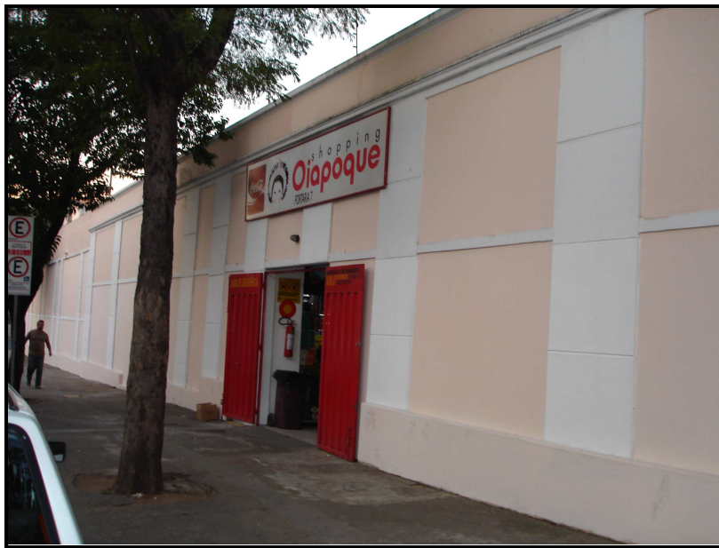
FIGURA 02: Entrada lateral do Shopping Oiapoque

O imóvel, então de propriedade da Ambev, foi vendido para um empresário, que o comprou com objetivo de transformar suas ruínas em um “camelódromo”. Suas instalações foram reformadas, além da Avenida Oiapoque ter passado por ampla revitalização.