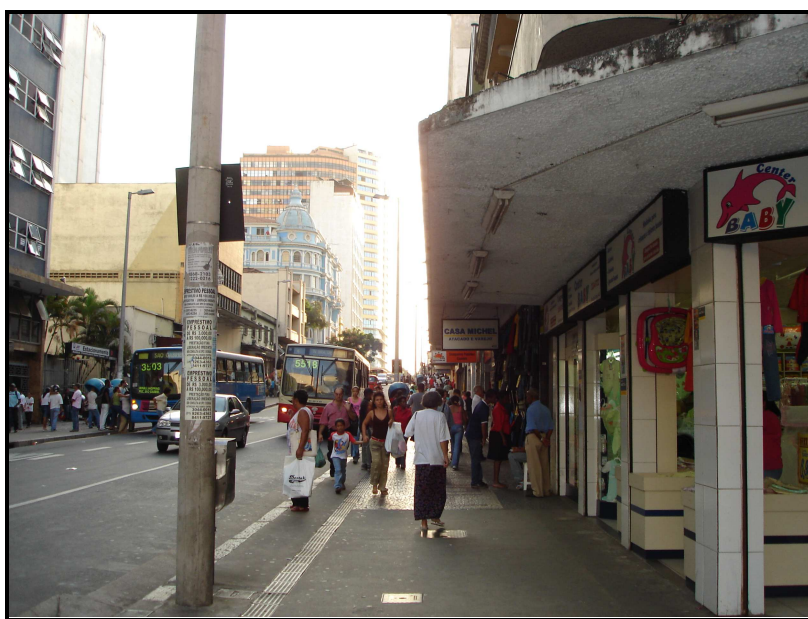
FIGURA 21: Rua Caetés revitalizada

Sua localização pode ser considerada como a melhor em relação aos shoppings populares, devido à sua centralidade, ao movimento presente nas ruas mencionadas. Tais ruas concentram um grande número de lojas e ainda várias linhas de ônibus trafegam com embarque e desembarque de passageiros.