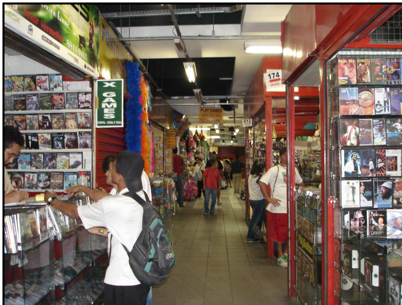
FIGURA 18: Parte interna no Shopping Tupinambás

Diferentemente dos outros shoppings , o Tupinambás possui corredores largos, facilitando a circulação dos consumidores e, além disso, em alguns pontos foram colocados bancos para descanso, oferecendo um maior conforto ao público que frequenta o espaço.