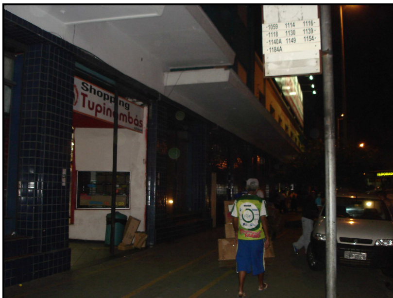
FIGURA 16: Entrada do Shopping Tupinambás pela Rua Rio Grande do Sul