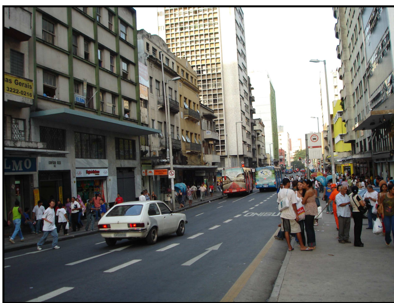
FIGURA 22: Rua Caetés onde está localizado o Shopping Caetés