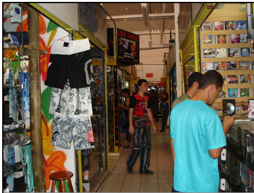
FIGURA 06: Segundo andar do Shopping Oiapoque