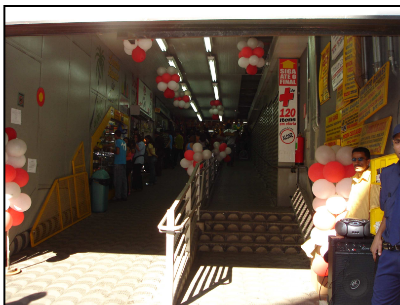
FIGURA 11: Entrada do Shopping Xavantes pela Rua Curitiba

Internamente percebe-se uma outra particularidade do Xavantes, que é ter somente um andar, assim, os boxes estão todos no mesmo nível, mas, como nos outros shoppings