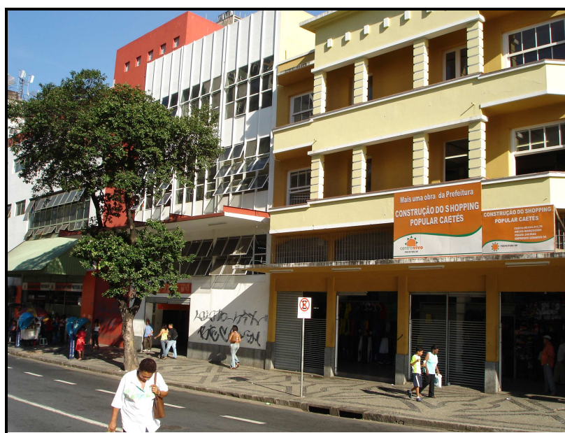
FIGURA 25: Fachada externa do Shopping Caetés pela Av. Santos Dumont

A estrutura interna do shopping é confusa: com poucas placas indicativas – as existentes não cumprem bem o seu papel – há muitas rampas e escadas que dificultam a locomoção de pessoas; há muitos corredores; a organização das lojas é mal feita; existem vários pisos em níveis diferentes e uma iluminação precária agravada pela pintura escura e o