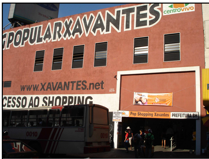
FIGURA 09: Fachada externa do Shopping Xavantes

O sorteio das vagas para ocupação do shopping Xavantes ocorreu em julho de 2004 e a transferência para ele aconteceu em 9 de agosto de 2004. Foram sorteadas 200 vagas para camelôs e toreros cadastrados.