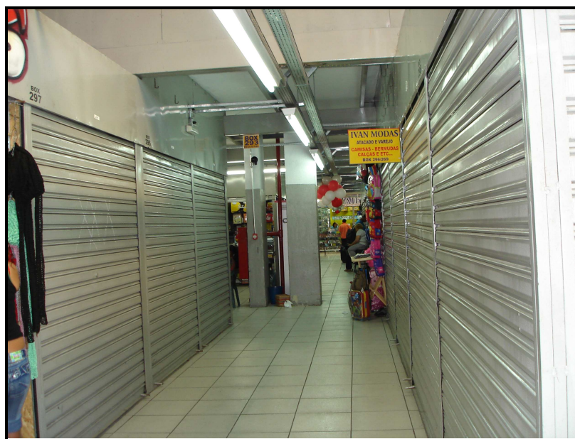
FIGURA 12: Boxes fechados no Shopping Xavantes

Durante a pesquisa de campo foram encontrados 24 boxes fechados, alguns à venda e outros disponibilizados para aluguel.