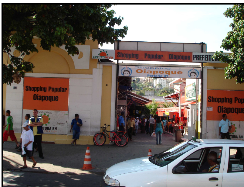
FIGURA 01: Entrada do Shopping Oiapoque

Assim, por meio da “Operação Urbana do Conjunto Arquitetônico da Avenida Oiapoque” foi criado o Shopping Popular Oiapoque, e hoje considerado o de maior sucesso. A inauguração desse centro de compras foi em agosto de 2003, anterior ao Código de Posturas do município, e localiza-se à Avenida Oiapoque, 176, Centro. Possui três entradas na Avenida Oiapoque, todas bem sinalizadas, largas e movimentadas e, possui, ainda, uma entrada pela avenida dos Andradas, um pouco menor que as demais e, também, menos movimentada. Seu prédio, local onde anteriormente funcionou uma fábrica de cerveja, destaca-se dentro do conjunto arquitetônico da região e foi tombado pelo Conselho Deliberativo do Patrimônio Histórico do Município em 1991. Em 2000, uma nova legislação foi publicada, dando proteção à antiga cervejaria e oferecendo novas condições para a restauração da edificação.