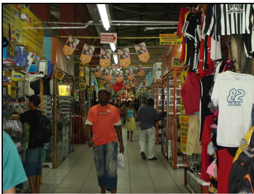
FIGURA 14: Parte interna do Shopping Xavantes