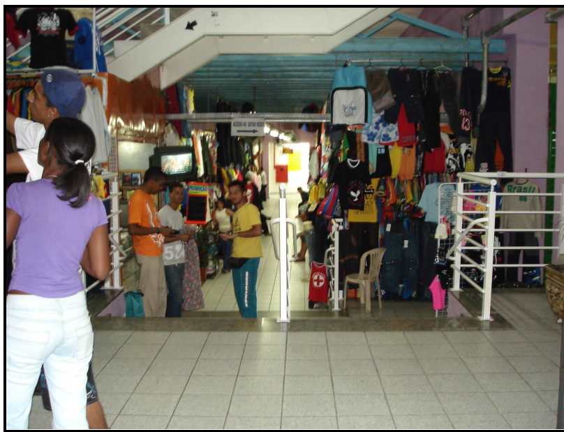
FIGURA 07: Segundo andar do Shopping Oiapoque

Os produtos vendidos no Oiapoque são aqueles comercializados em todos os outros shoppings populares (roupas, cds, brinquedos, calçados, acessórios para celular, etc.) com apenas um diferencial no que diz respeito aos eletroeletrônicos. No shopping Oiapoque são encontrados desde os produtos de baixo preço, como rádios a pilhas e fones de ouvido (o que o torna comum aos outros shoppings ) até os de alto valor comercial e de grande tecnologia, como dvd's portáteis, câmaras digitais, filmadoras e acessórios/suprimentos de informática, bolsas e bijuterias que imitam marcas famosas, tais como Louis Vuitton , Pólo , Hugo Boss o que o diferencia enormemente dos demais.