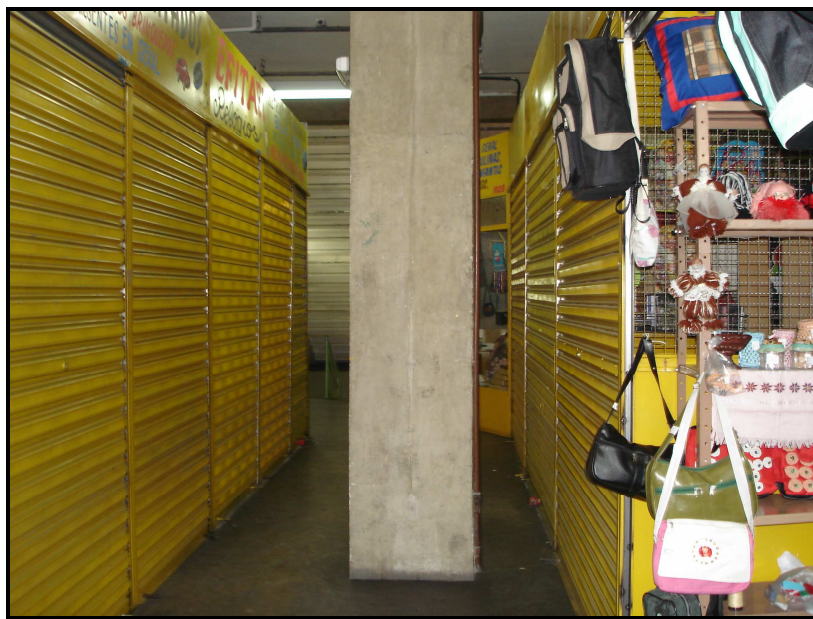
FIGURA 28: Parte interna do Shopping Caetés