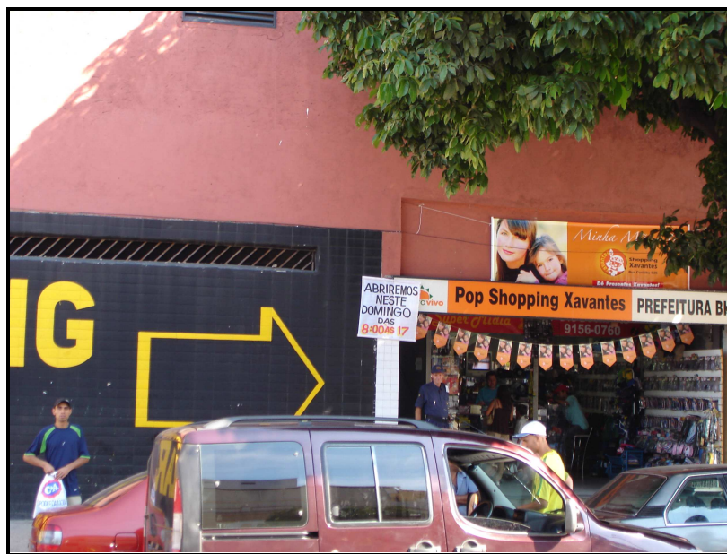
FIGURA 10: Entrada do Shopping Xavantes pela Rua Oiapoque

shopping . Essa peculiaridade dificulta a sua visualização limitando, de alguma forma, o acesso dos consumidores ao local.