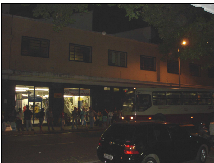
FIGURA 17: Entrada do Shopping Tupinambás pela Av. do Contorno

Tentando aumentar a movimentação de pedestres na região, a PBH transferiu alguns pontos de embarque e desembarque de ônibus para as proximidades do Tupinambás. De