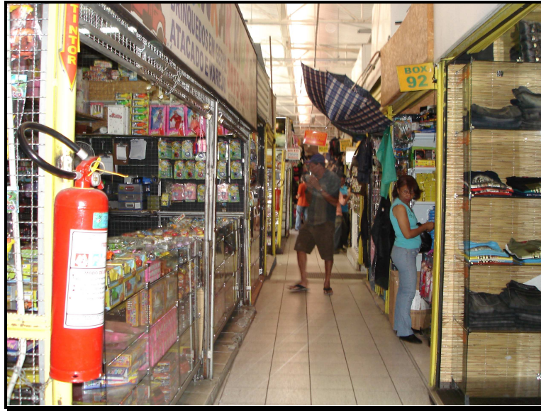
FIGURA 05: Parte interna do Shopping Oiapoque