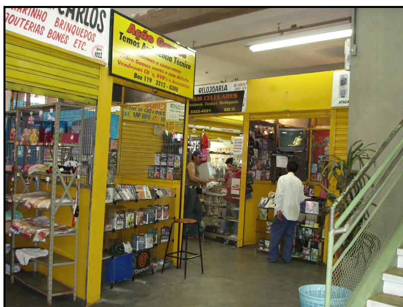
FIGURA 27: Parte interna do Shopping Caetés