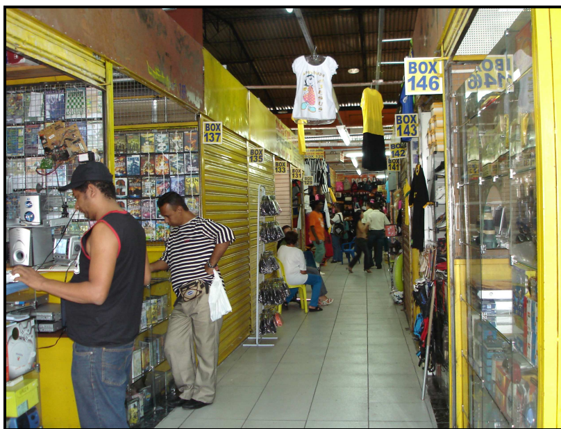
FIGURA 13: Parte interna do Shopping Xavantes

Os corredores centrais têm uma circulação significativa de consumidores e percebe-se uma boa movimentação de clientes nos boxes. Porém, em alguns pontos, principalmente em suas laterais, observa-se uma circulação quase mínima de pessoas.