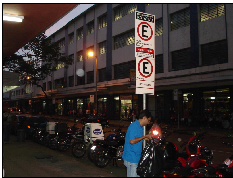
FIGURA 15: Entrada do Shopping Tupinambás pela Rua Tupinambás

O Shopping Tupinambás foi inaugurado em 09 de agosto de 2004, e o sorteio dos boxes ocorreu em julho do mesmo ano. Está localizado na Rua Rio Grande do Sul nº 54, antigo prédio da Mesbla Veículos, em uma região pouca movimentada, quando comparada com a circulação de pedestres presentes nos outros shoppings populares. Possui entradas por todas as ruas e avenidas que o circundam, facilitando o acesso dos pedestres. Assim, as entradas estão localizadas na Av. do Contorno, Rua Rio Grande do Sul e Rua Tupinambás. Apesar de o shopping se localizar nas mediações do Terminal Rodoviário de Belo Horizonte, seu acesso para o pedestre é dificultado, seja pela distância, seja pelo comércio local. Isso porque esse comércio é pouco atrativo para grande maioria dos consumidores, limitando-se a lojas do ramo de auto-peças, material elétrico e pesca.