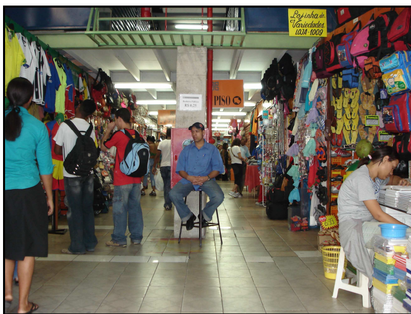
FIGURA 29: Parte interna do Shopping Caetés

No shopping , os produtos mais comercializados são roupas (algumas de fabricação própria), brinquedos, relógios, bolsas, acessórios para celulares, material de pescaria, bordados, flores, cds, livros infantis, óculos, bijuteria e eletroeletrônicos de baixo preço. É interessante pontuar que, ao se fazer uma pesquisa de preço de alguns produtos