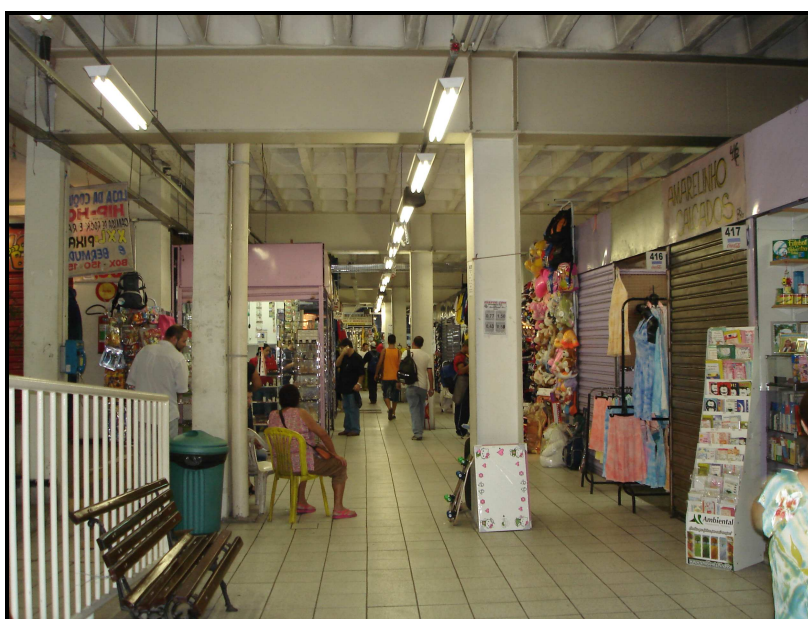
FIGURA 19: Parte interna no Shopping Tupinambás